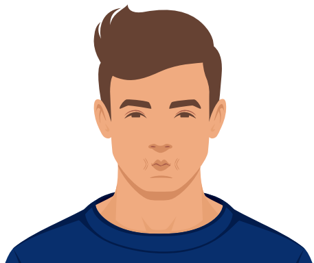
Den Mund spitz machen