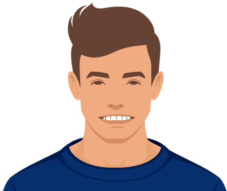
Auf die Oberlippe beißen