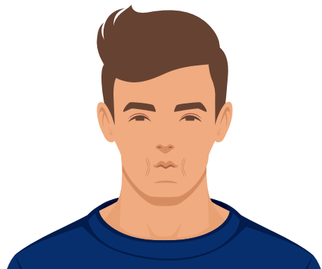
Die Wangen einsaugen