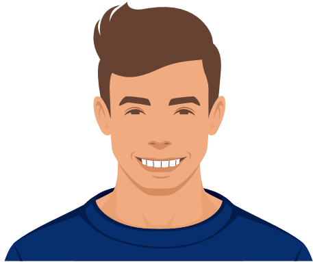
Auf die Unterlippe beißen