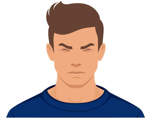
Beide Augen zukneifen